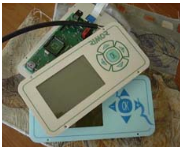
Figura 1 "Centraline Modello 1998/1999 5 tasti"

Per i mezzi equipaggiati con il tipo di centralina di Figura 1 (modello 1998/1999 a 5 tasti) si devono eseguire i seguenti passi: