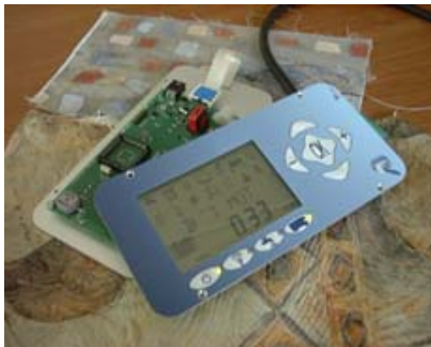
Figura 3 "Centraline modello 1999/2000 a 9 tasti"

Per i mezzi equipaggiati con il tipo di centralina di Figura 3 (modello 1999/2000 a 9 tasti) si devono eseguire i seguenti passi: